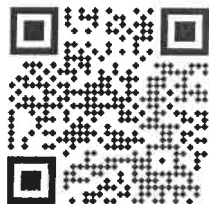
Сайт ГБОУДО им. А.В. Косарева