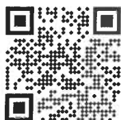
Сайт ГБОУДО им. А.В. Косарева